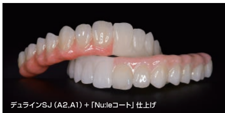
デュラインSJ (A2, A1) + 「Nucleコート」仕上げ